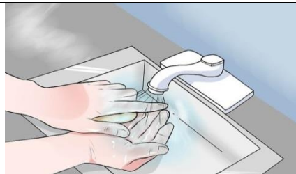
دستها را مجدداً بشویید و دستکش جدید بپوشید.