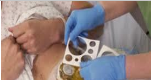
دهانه استوما را اندازه گیری و کیسه مناسب آن را انتخاب کنید.