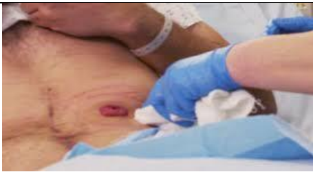
پوست اطراف استوما را توسط گاز به صورت کامل خشک کنید.