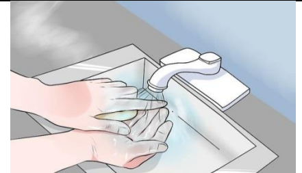
دستها را بشویید.