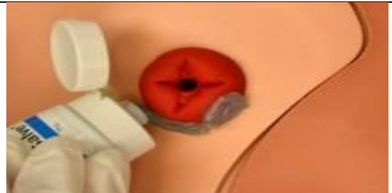
یک لایه از پماد ضد سوختگی را روی پوست اطراف استوما بیافزایید.