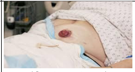
مددجو را در پوزیشن نیمه نشسته قرار دهید و پوشش های روی ناحیه زخم را بردارید.