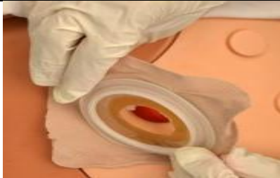
کیسه پر را از محل استوما جدا کنید.