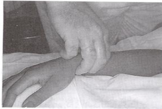
نحوه قرارگیری دست پرستار و دست مددجو در اندازه گیری نبض رادیال