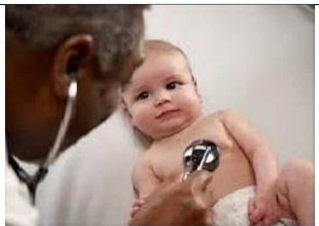
نحوه قرار گیری گوشی پزشکی در فضای بین دنده ای پنجم و طرف چپ استخوان جناغ برای بررسی نبض اپیکال در نوزادان و کودکان ۲-۳