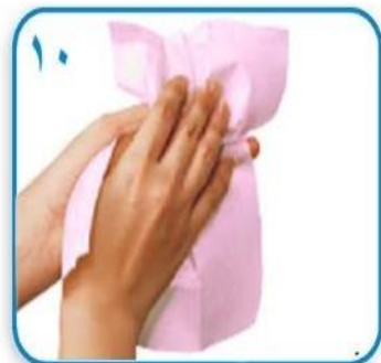
۱۰ با یک دستمال حوله ای بطور کامل خشک کنید