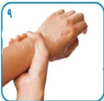
۹ مچ دستها را کاملا آبکشی نمایید