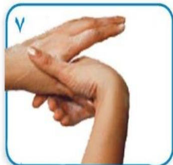
۷ مالش گردشی شست یک دست در داخل کف دست دیگر و بالعکس