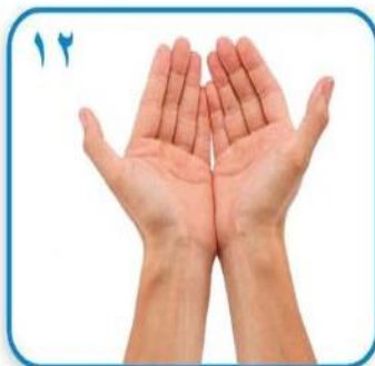
۱۲ اکنون دستهای شما کاملا تمیز و مطمئن هستند