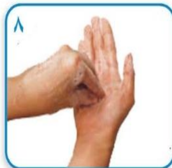
۸ مالش های مدور و رفت و برگشتی با انگشتان بسته یک دست روی کف دست دیگر و بالعکس