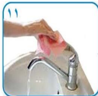
۱۱ از همان دستمال برای بستن شیر آب استفاده کنید