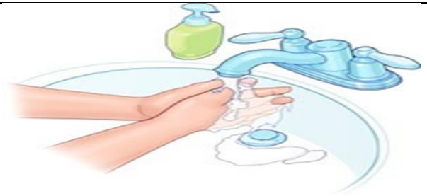
دست ها را بشوید