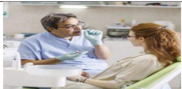
مددجو را در پوزیشن نشسته یا یک پهلو قرار دهید.