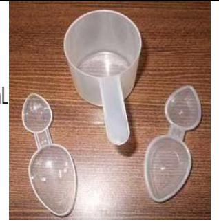
نمونه هایی از کاپ دارویی که برای دادن شربت ها استفاده میشود.