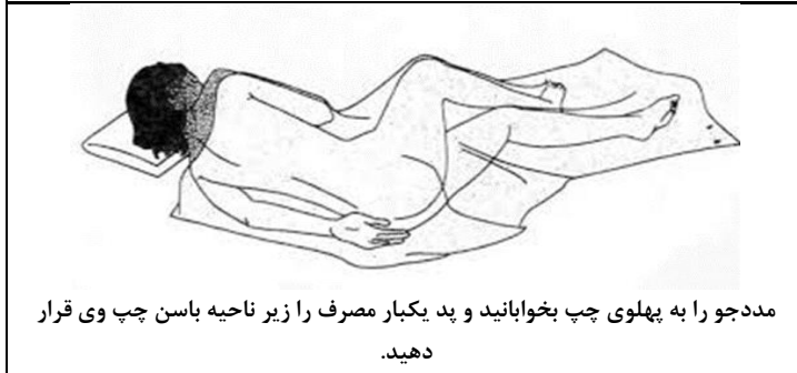
مددجو را به پهلوئی چپ بخوابانید و پد یکبار مصرف را زیر ناحیه باسن چپ وی قرار دهید.