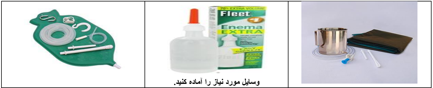
وسایل مورد نیاز را آماده کنید.