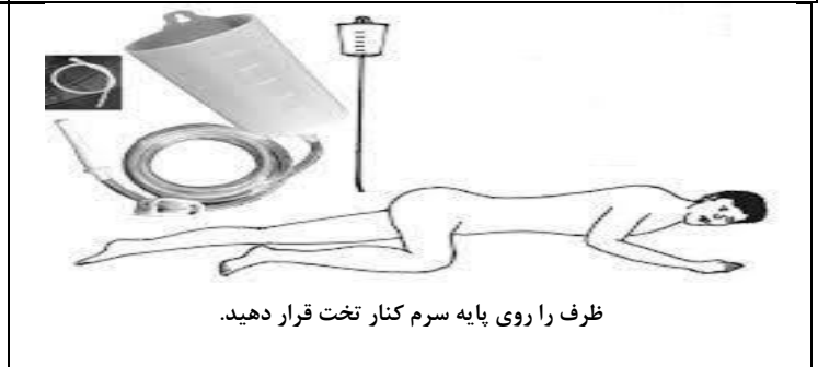
ظرف را روی پایه سرم کنار تخت قرار دهید.