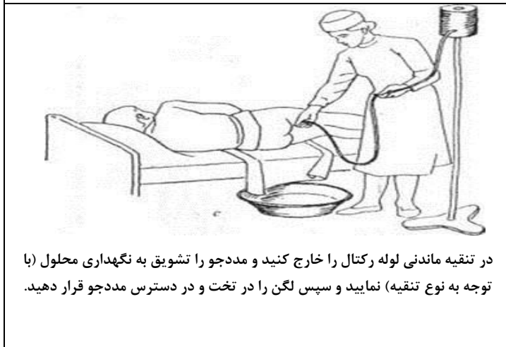
در تنقیه ماندنی لوله رکتال را خارج کنید و مددجو را تشویق به نگهداری محلول (با توجه به نوع تنقیه) نمایید و سپس لگن را در تخت و در دسترس مددجو قرار دهید.