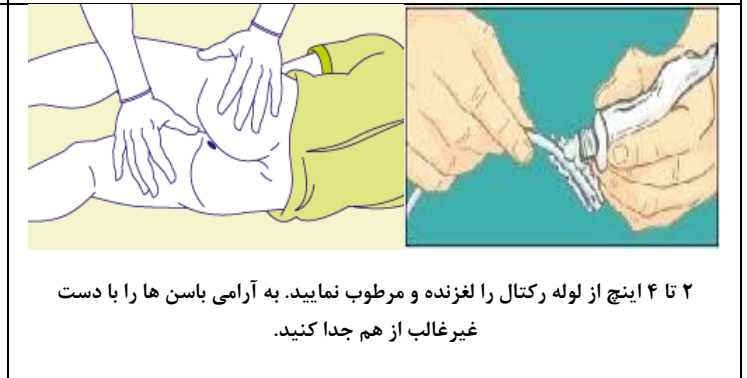
۲ تا ۴ اینچ از لوله رکتال را لغزنده و مرطوب نمایید. به آرامی باسن ها را با دست غیر غالب از هم جدا کنید.