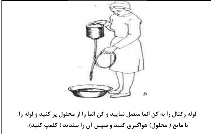
لوله رکتال را به کن انما متصل نمایید و کن انما را از محلول پر کنید و لوله را با مایع (محلول) هواگیری کنید و سپس آن را ببندید (کلمپ کنید).