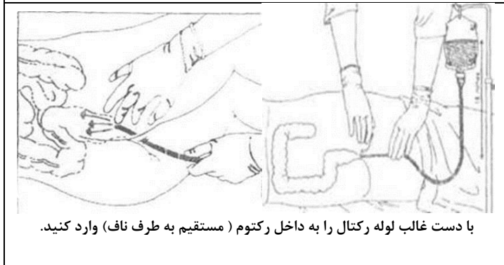
با دست غالب لوله رکتال را به داخل رکتوم (مستقیم به طرف ناف) وارد کنید.